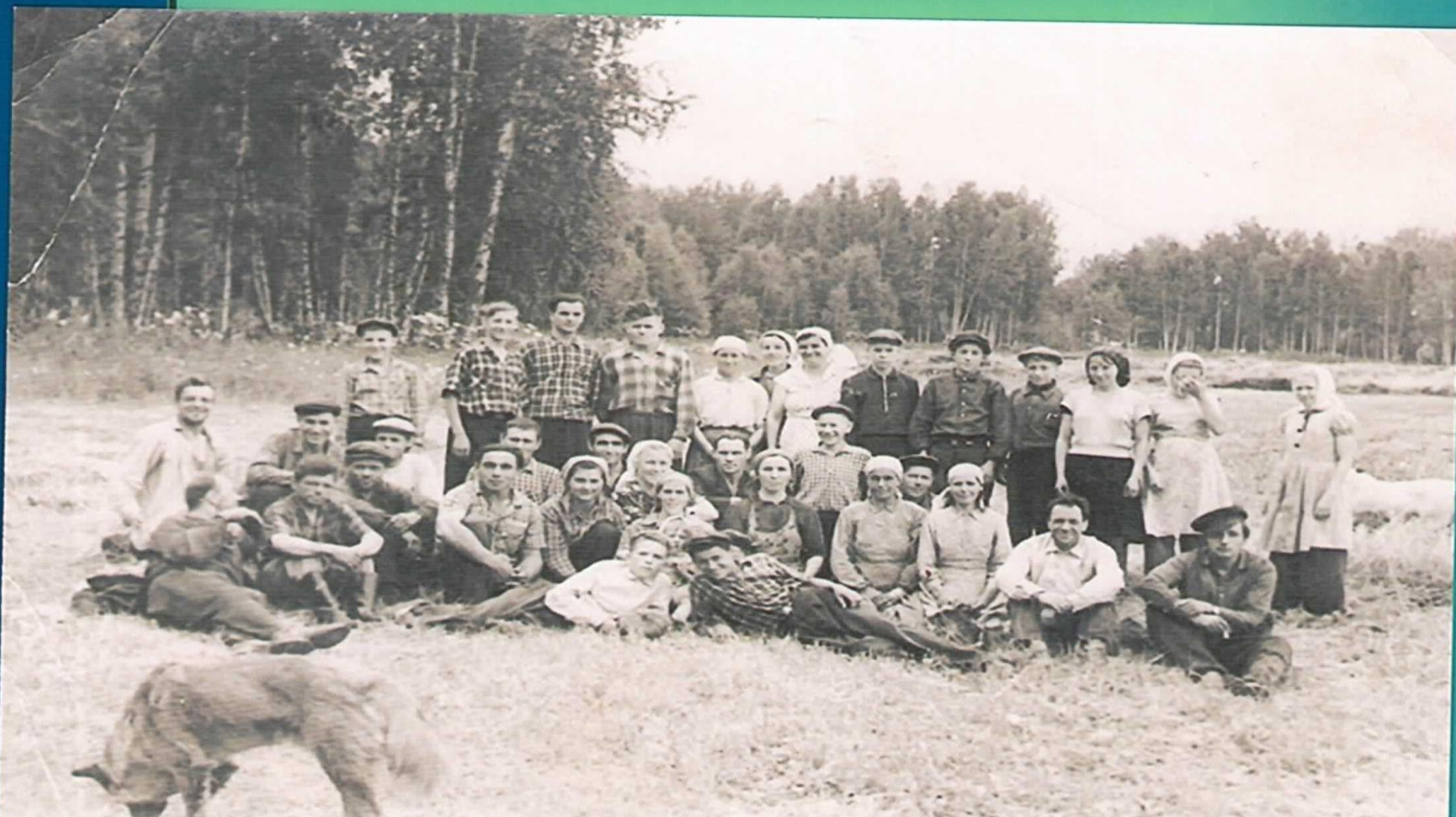
Бригада №5, 1962 год